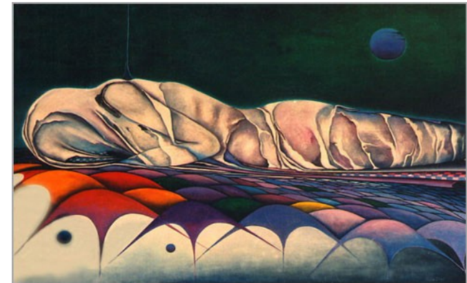
Crisalide-olio su tela 1995-Giulio Orioli

Se è inguaribile la malattia occorre prendersi cura di ciò che resta sano: il Senso della Vita